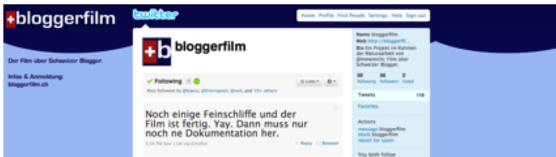
Abbildung 7: Screenshot der Twitterseite des Projekts

Twitter ist eine Plattform, auf welcher es möglich ist, Nachrichten mit der maximalen Länge von 140 Zeichen zu verbreiten. Jeder Benutzer kann anderen Benutzern folgen, was bedeutet, dass er auf seiner Startseite die Nachrichten dieses Benutzers sehen kann. Jeder kann auf die Nachrichten von anderen Benutzern, die Tweets genannt werden, antworten. Dadurch kann ein Dialog zwischen den Benutzern und ein Infoaustausch in Echtzeit entstehen.