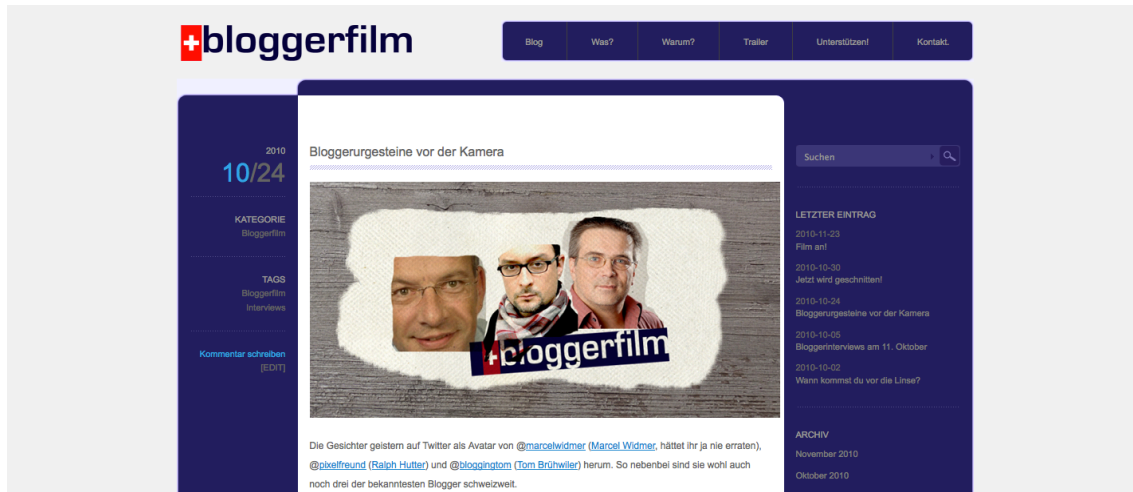
Abbildung 5: Beispiel eines veröffentlichten Blogbeitrages