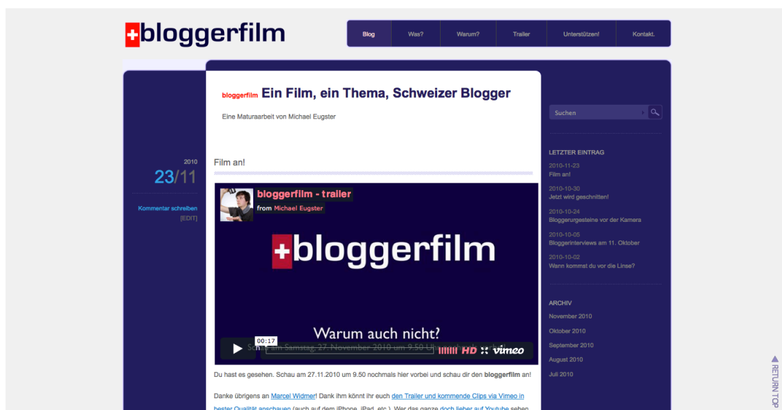
Abbildung 3: Homepage http://bloggerfilm.ch