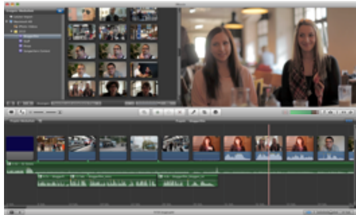
Abbildung 12: Screenshot Filmschnitt in iMovie

Wenn man Videoeffekte auf einen Clip anwenden möchte, muss der Clip jedoch konvertiert werden, da der h.264-Videoencoder nicht für den Videoschnitt entwickelt wurde, sondern um Videos bei guter Qualität zu komprimieren. Er eignet sich also gut zum Abspielen.