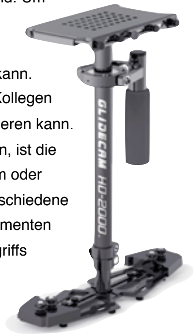
Abbildung 2: Glidecam HD-2000

Damit die Aufnahmen für den Betrachter des Filmes angenehm sind, musste sichergestellt werden, dass die Aufnahmen ruhig sind. Um die Aufnahmen zu stabilisieren wurde beim Dreh hauptsächlich ein normales Stativ verwendet, das man auch für normale Fotoaufnahmen verwenden kann. Zusätzlich informierte ich mich im Internet und bei Kollegen darüber, wie man die Aufnahmen zusätzlich stabilisieren kann. Eine weitere Möglichkeit, Aufnahmen zu stabilisieren, ist die Verwendung eines Schwebestativs (auch Steadicam oder Steadicam genannt). In diesem Bereich gibt es verschiedene Lösungen, die sich auch in verschiedenen Preissegmenten bewegen. Das Original des Lizenzinhabers des Begriffs Steadicam kostet ungefähr 1000.- CHF, ein etwas anderes Prinzip der Firma Glidecam kostet ungefähr 500.- CHF und Johnny Lee bewirbt auf seiner Website 2 ein Stativ zum Selberbauen, das laut seinen Angaben bloss 14$ kosten soll. In dieser