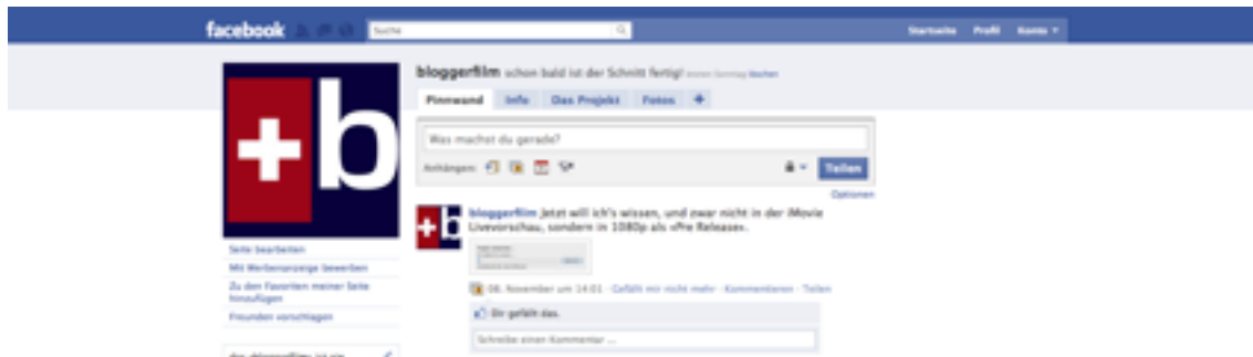
Abbildung 8: Facebook-Seite des Projekts

Facebook ist ebenfalls ein Social Network, das den Benutzern erlaubt, miteinander zu kommunizieren. Jeder Benutzer kann seine Privatsphäre-Einstellungen machen, die bestimmen, welche Informationen andere Benutzer von Facebook sehen dürfen. Meistens zeigen Benutzer anderen Benutzern nur dann alle Informationen, wenn sie mit ihnen befreundet sind. Dies ist wohl der grösste Unterschied zwischen Facebook und Twitter.