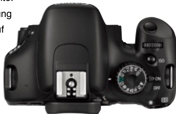
Abbildung 1: Canon EOS 550D

Als Entscheidungsgrundlage wurden zum einen die technischen Daten der verschiedenen Kameras verwendet, die man unter canon.com einsehen kann, zum anderen verschiedene Videobeispiele auf vimeo.com .